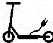
Elektrofahrzeuge im Sinne der Elektrokraftfahrzeuge-Verordnung (eKFV)

(8) Bei besonderen Gefahrenlagen können als Gefahrzeichen nach Anlage 1 auch die Sinnbilder "Viehtrieb" und "Reiter" und Sinnbilder mit folgender Bedeutung angeordnet sein: