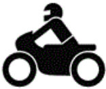
Kraftfahrzeuge, auch mit Beiwagen, Kleinkraftfahrzeuge und Mofas