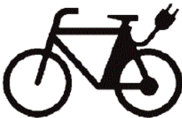
Einsitzige zweirädrige Kleinkraftfahrzeuge mit elektrischem Antrieb, der sich auf eine bauartbedingte Geschwindigkeit von nicht mehr als 25 km/h selbsttätig abregelt