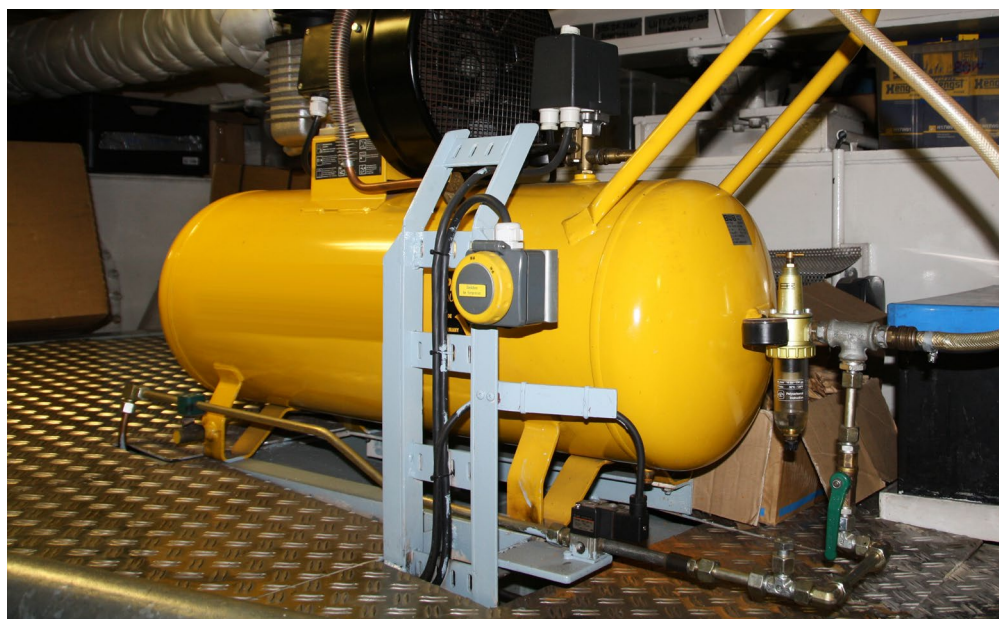
Abb. 1 Prüfungen sind Voraussetzung für den sicheren Betrieb

Für Fahrgastschiffe, die den Vorschriften einer anerkannten Klassifikationsgesellschaft entsprechen, sind in dieser Prüfinformation keine Detailprüfungen aufgeführt, die ausschließlich anlässlich einer Klassenbesichtigung durchgeführt werden müssen. Diese Prüfungen und deren Dokumentation werden von der Klassifikationsgesellschaft und nicht von Schiffseignerinnen und Schiffseignern veranlasst und verantwortet.