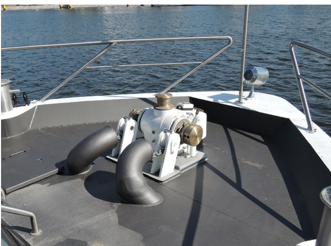
Abb. 2 Gerade Ankerwinden müssen geprüft sein

Alles, was bezüglich Bau und Ausrüstung in den staatlichen Vorschriften über die Verkehrszulassung (z. B. Binnenschiffsuntersuchungsordnung – siehe Abschnitt 2.1.3) gefordert wird, ist Teil des Fahrgastschiffes und wird nicht durch das Produktsicherheitsgesetz, sondern durch die in den Abschnitten 2.1.3 und 2.1.4 genannten Vorschriften geregelt.