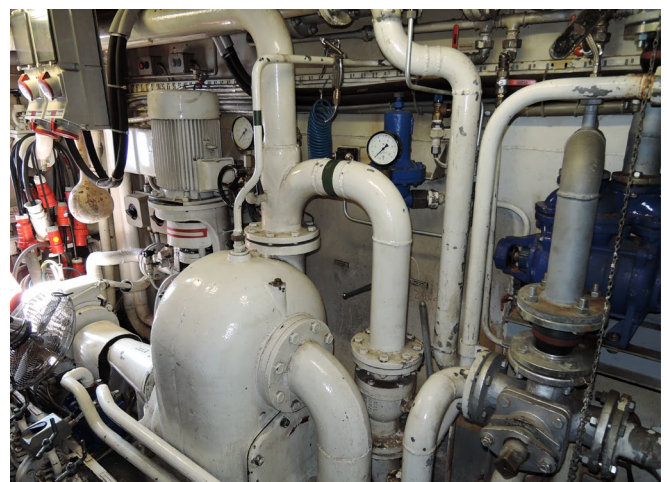
Abb. 3 Auch in der BinSchUO sind Prüfungen geregelt.