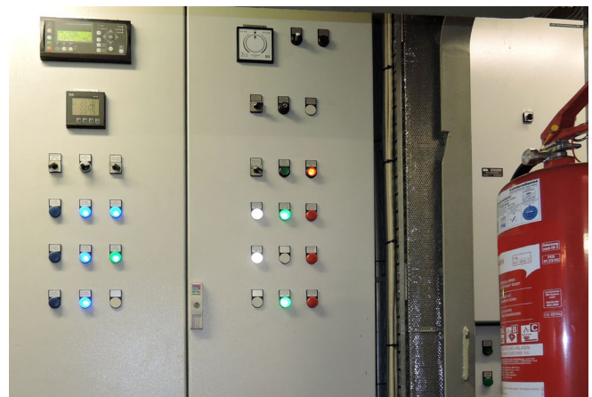
Abb.10 Elektroprüfungen sind nur mit Fachkompetenz möglich