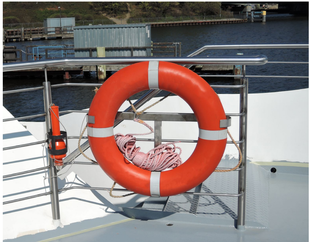
Abb.6 Selbst am Rettungsring gibt es viel zu prüfen.

Droht dem Unternehmer in einem solchen Fall die Inanspruchnahme auf Zahlung von Schadensersatz, ein strafrechtliches Ermittlungsverfahren oder ein behördliches Bußgeld, muss er nachweisen, dass er seinen Sorgfalts- bzw. Prüfpflichten nachgekommen ist. Zur eigenen Absicherung ist es daher unerlässlich, dass die durchgeführten Prüfungen und Angaben, die auch die ausreichende Qualifikation der Prüfenden belegen, entsprechend festgehalten werden.