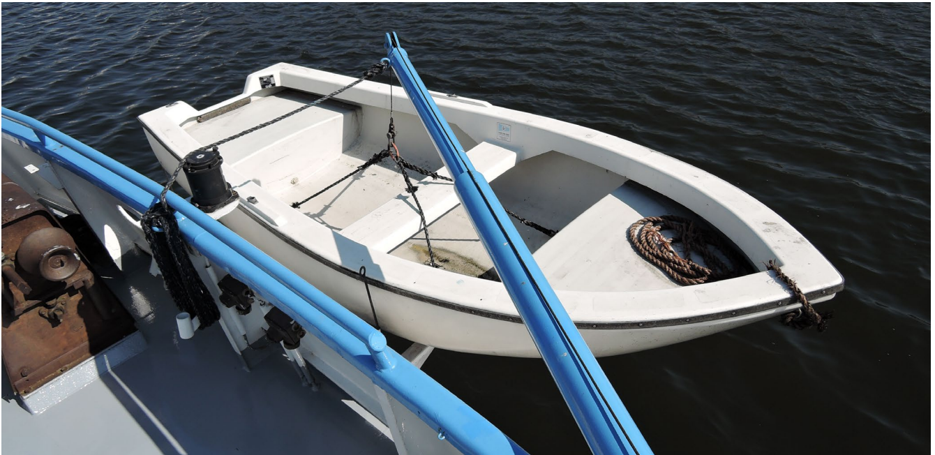
Abb. 4 Regelmäßig geprüft bringt es Sicherheit