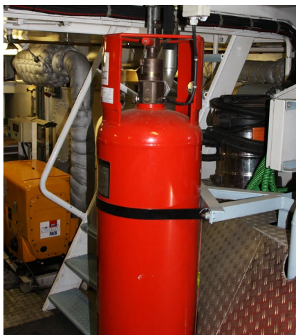
Abb. 5 Prüfungen sind auch eine Frage der Verantwortung

Unternehmer haben nicht nur die ethische Verpflichtung, die Arbeit an Bord so zu gestalten und zu organisieren, dass Arbeitsunfälle vermieden werden. Das Unterlassen von Prüfungen der zur Benutzung bereitgestellten Arbeitsmittel oder überwachungsbedürftigen Anlagen (z. B. Druckluftbehälter) und der Dokumentation dieser Prüfungen kann empfindliche juristische Konsequenzen nach sich ziehen.