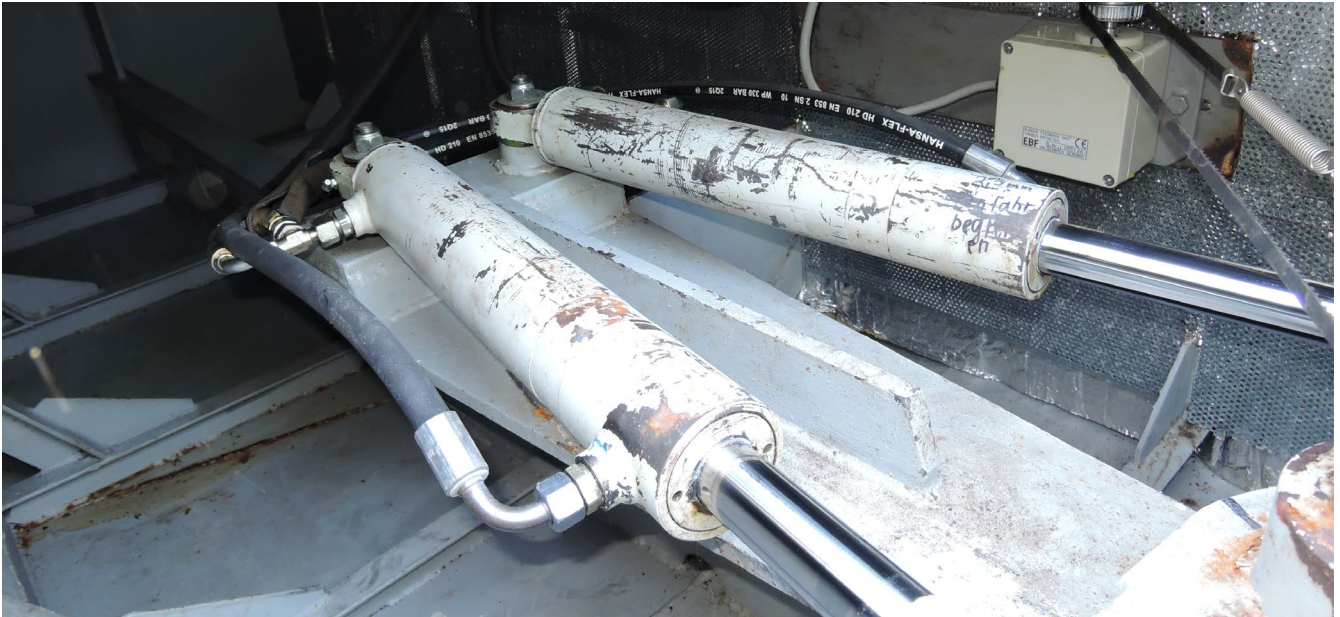
Abb.11 Prüfungen können Systemausfälle verhindern!

Nur ein Beispiel: Das stets und ständig verwendete Verlängerungskabel (siehe Anhang 4 Nr. 3.6 und 3.7), das unter allen Witterungsbedingungen zum Einsatz kommen soll, bedarf einer kurzfristigeren Prüfung, als eines, das nur gelegentlich in der Wohnung verwendet wird.