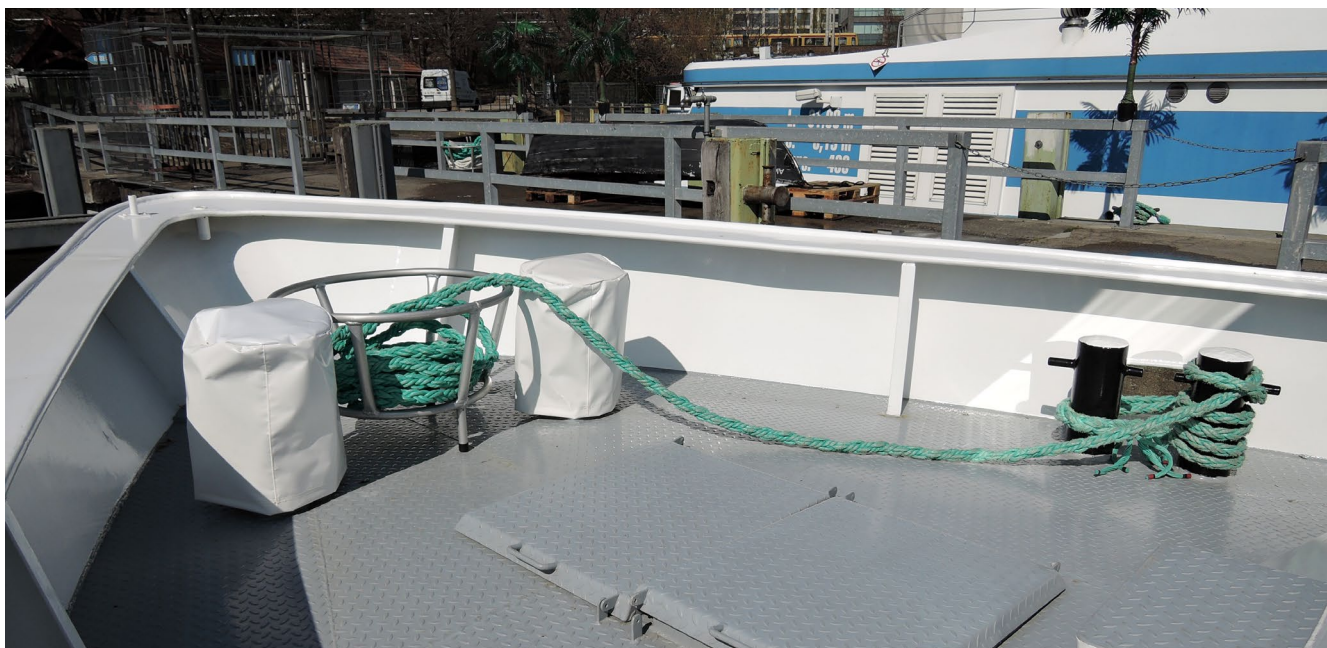
Abb.7 Das Tauwerk braucht eine regelmäßige Sichtprüfung