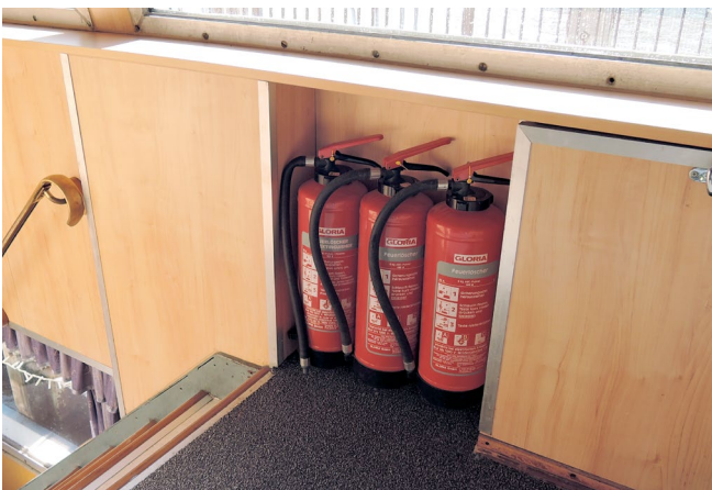
Abb.9 Die Feuerlöscher prüft der Sachkundige

Bei üblicher Nutzung des Objektes bietet es sich an, sich an den in den DGUV Vorschriften angegebenen Fristen zu orientieren. Bei sehr starker Nutzung eines Objektes müssen die Fristen verkürzt werden.